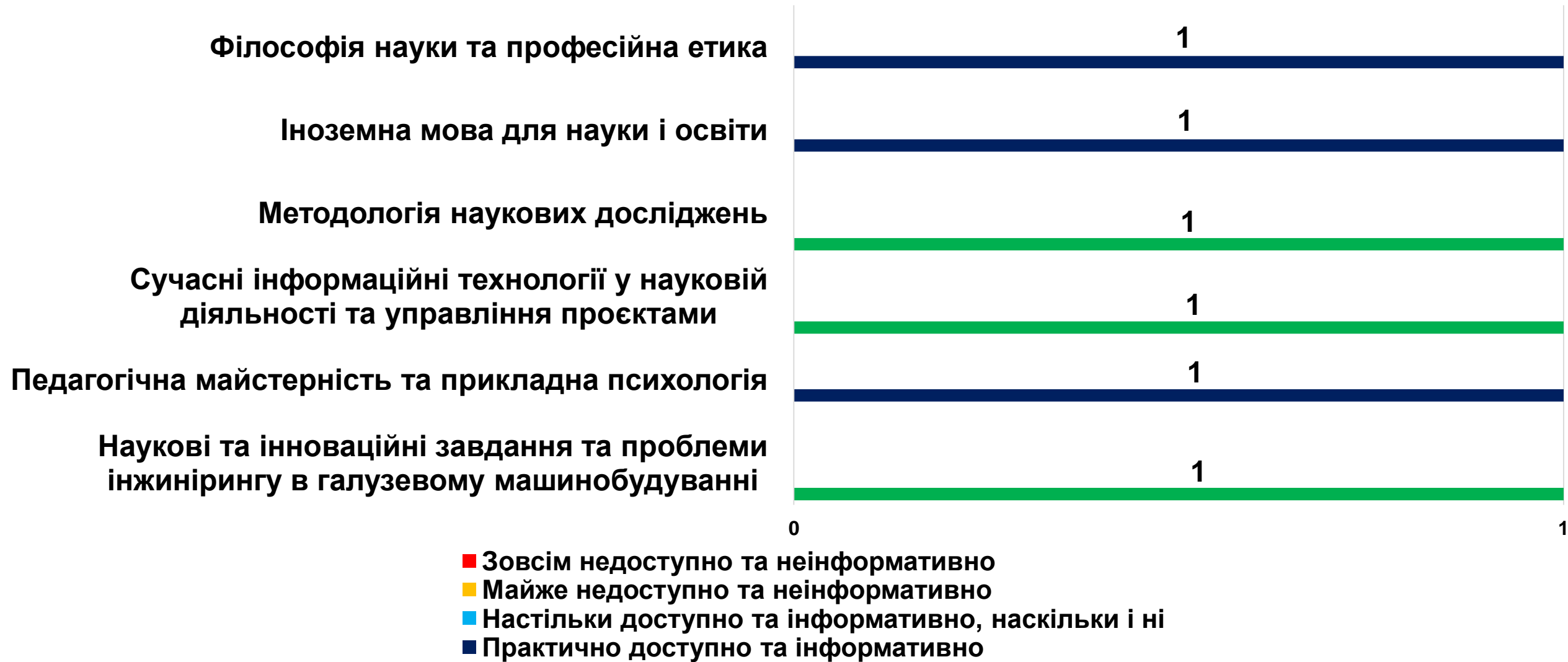
Рисунок 2 – рівень доступності та насиченості інформаційно-методичного забезпечення дисциплін освітньої програми